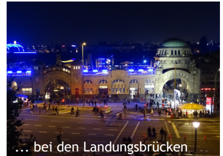
... bei den Landungsbrücken