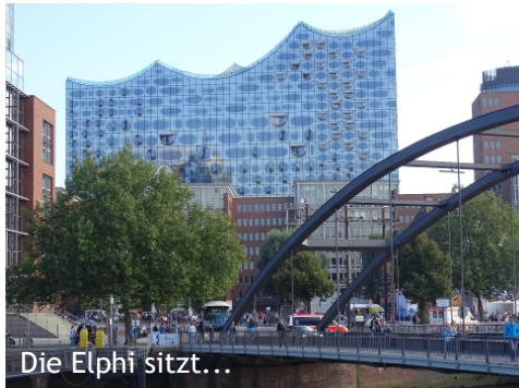
Die Elphi sitzt...