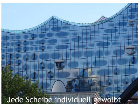
Jede Scheibe individuell gewölbt