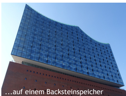
...auf einem Backsteinspeicher